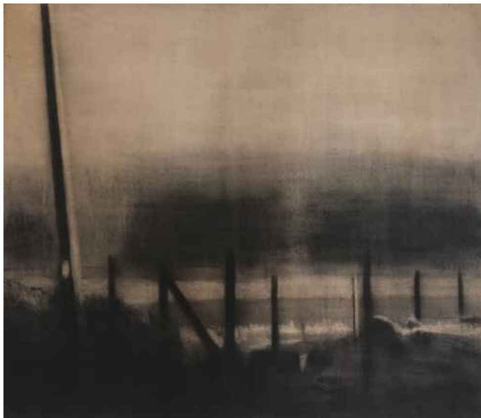
Ximena Cousiño. Série "Brumas". Fusain sur la jute. 115x100 cm. 2017