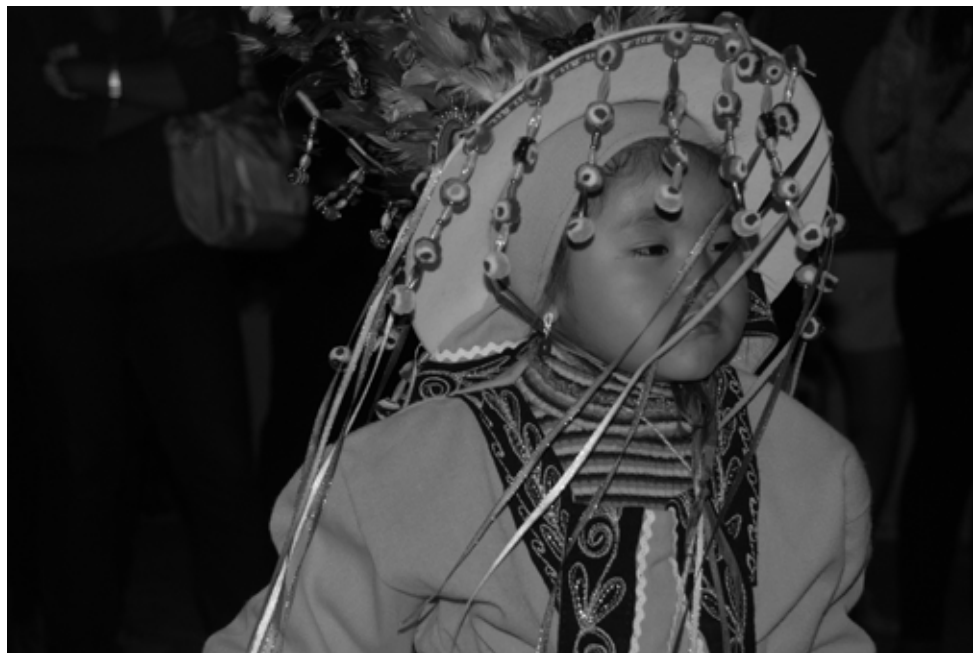
Lu de Rozas. Série Procession de la Vierge de Guadalupe (San Pedro de Atacama, Chili), 1/10. 20x30 cm. Impression numérique pigmentaire sur papier coton. 2013