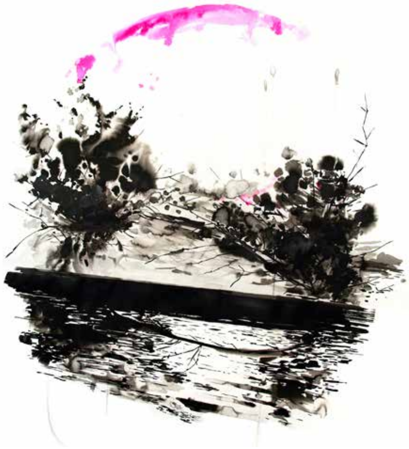
Carlos Araya. "Note de voyage III". Encre sur papier Fabriano. 125x125 cm. 2017