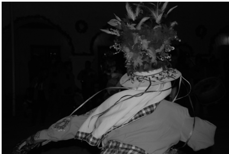
Lu de Rozas. Série Procession de la Vierge de Guadalupe (San Pedro de Atacama, Chili), 1/10. 20x30 cm. Impression numérique pigmentaire sur papier coton. 2013