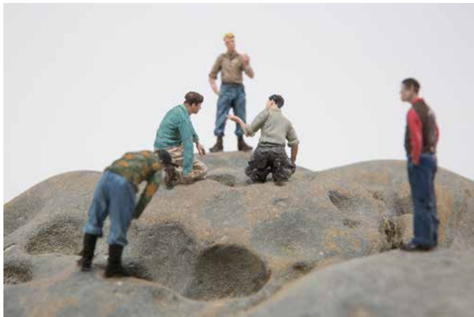
Marcela Yaconi. "Hombres buscando". Technique mixte, pierre et figures plastiques. 23x23x16 cm. 2017