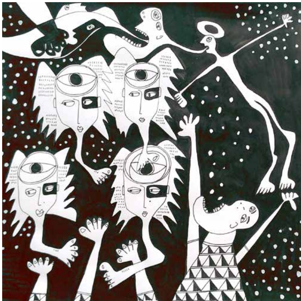
Marcelo Parmet. "Angelfoot". Encre et peinture acrylique sur papier. 30x30 cm. 2017