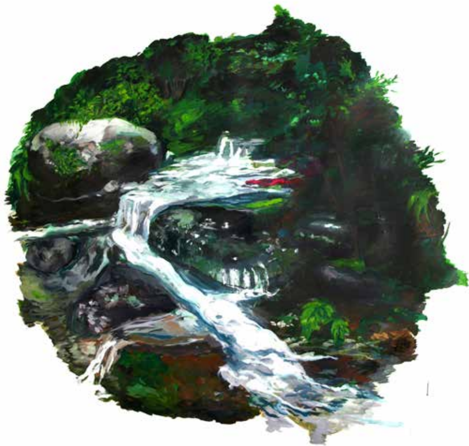
Carlos Araya. "Cascade". Huile sur toile. 130x130cm. 2017