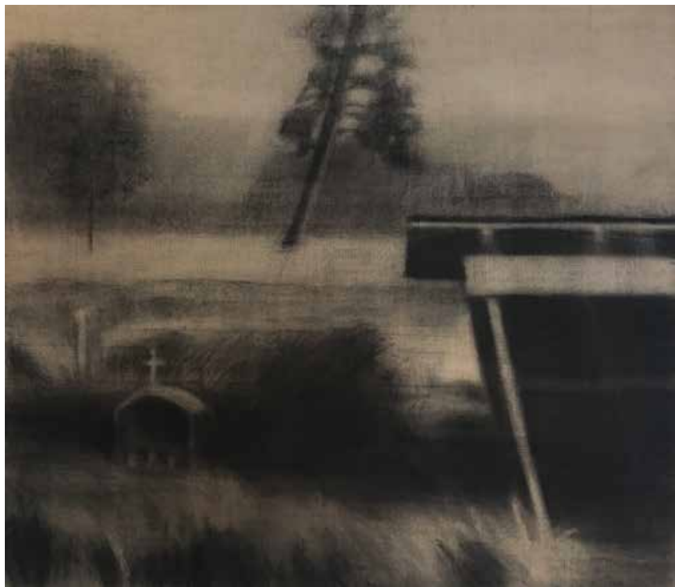
Ximena Cousiño. Série "Brumas". Fusain sur la jute. 115x100 cm. 2017