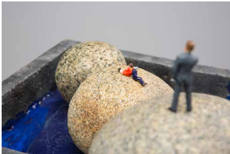
Marcela Yaconi. "Hombre dudando". Technique mixte, bois, pierre et figures plastiques. 23x23x36 cm. 2017